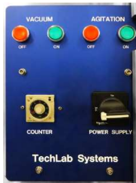
Panel de control