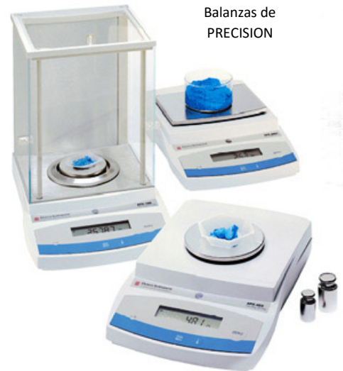
Balanzas de PRECISION

Puede operar de forma Autónoma o Integrado en el Sistema LYNX lo cual le dotaría de toda la potencia de Base de Datos, Estadísticas, Informes Configurables y en formato PDF, Informes Agrupados con otros parámetros generados en el Laboratorio de Ensayos.