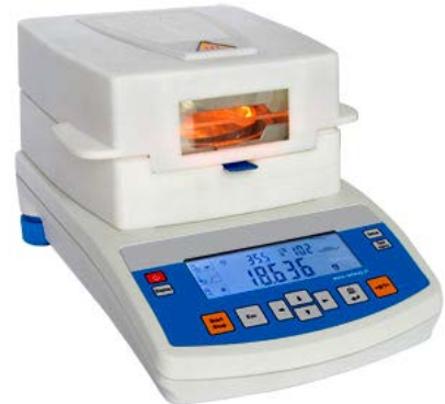
Analizador de HUMEDAD