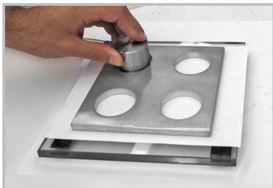
Medición de Rugosidad